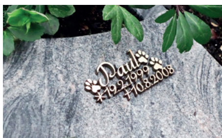
1) Öffnen und Schließen des Grabes, Beisetzung - Alle Preise inkl. erforderlicher MwSt.